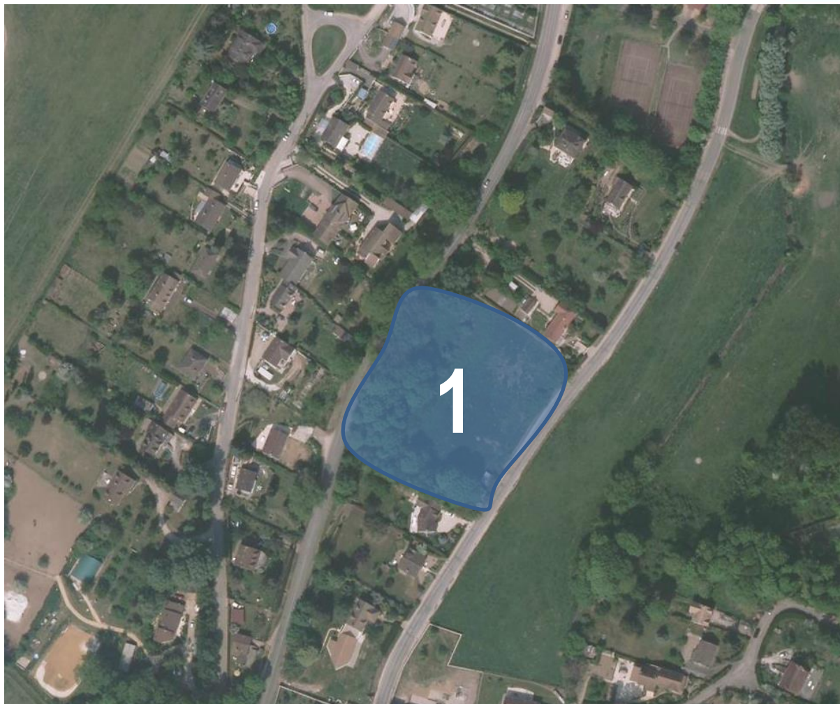
Zone soumise à une orientation d'aménagement et de programmation