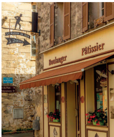
Maison du Pain à Commeny