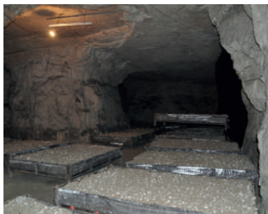
Champignonnière - Evécquemont