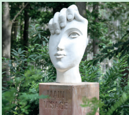
Main Visage. A.KASPER