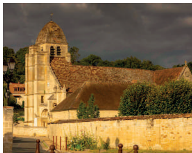
Eglise de Guiry-en-Vexin